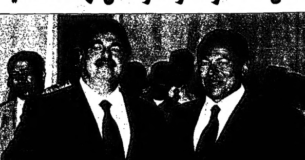
الفرس اللبناني اميل حودم مع رئيس الوزراء المستقيل رفيق الحريري في بيروت امس